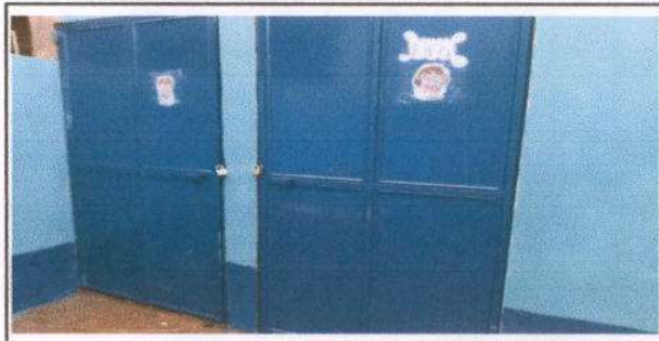
Foto 18: nuevos baños uno para niños y otro para niñas, con puertas nuevas

Observación: Si es necesario se pueden agregar hojas adicionales y actualizar las mismas.