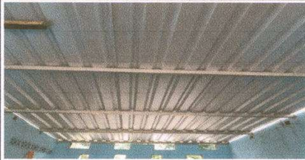
Foto13: Nuevo techo instalado