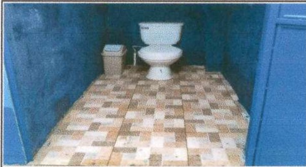
Foto 7: taza de baño lavable instalada y piso ceramico antideslizante