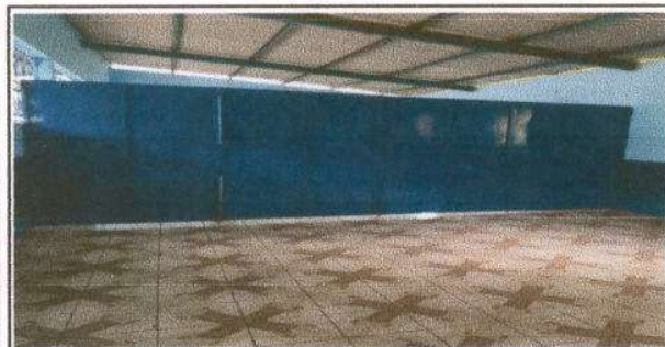
Foto 5: Nueva división de metal que separa las aulas de preprimaria y primer ciclo de primaria