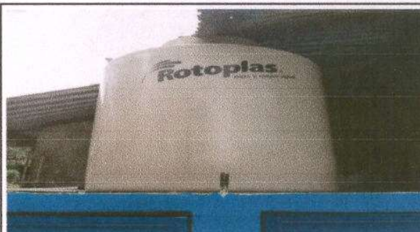
Foto 4: Instalación de rotoplas para abastecimiento de agua y para sanitarios.