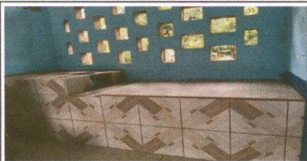
Foto 17: plancha de metal instalada, fogón con cerámica y ampliada