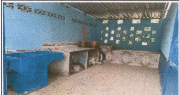
Foto 16: pila de cemento de dos lavaderos instalada y fogón nuevo