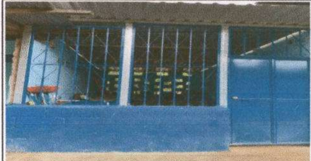
Foto 14: Ventanales de la cocina con estructura de metal nuevas instaladas